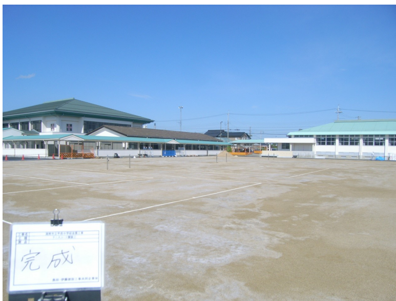
滋賀県 甲西中学校