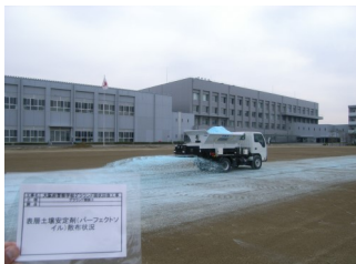
パーフェクトソイル散